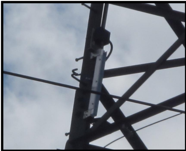
Sensor im Detail